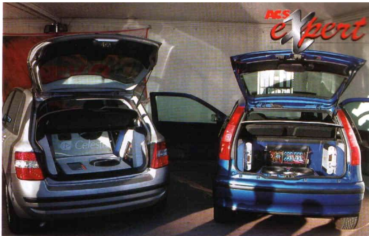
Le due vetture in esposizione con prodotti Celestra realizzate dai due installatori protagonisti della manifestazione.